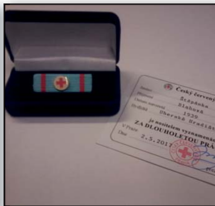
Ocenění za dlouholetou práci v ČČK