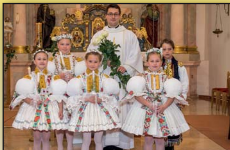
První svaté přijímání