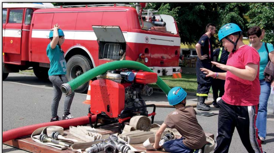
Dětský den – požární útok mladých hasičů