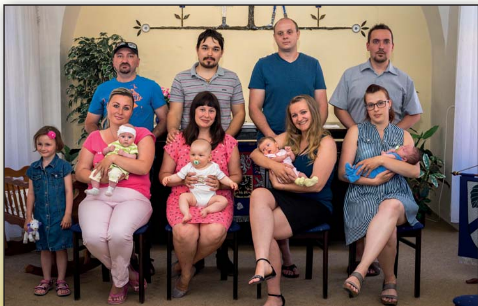
3. 6. 2017 jsme v obřadní síni přivítali naše nejmladší občánky. Vítejte mezi námi.