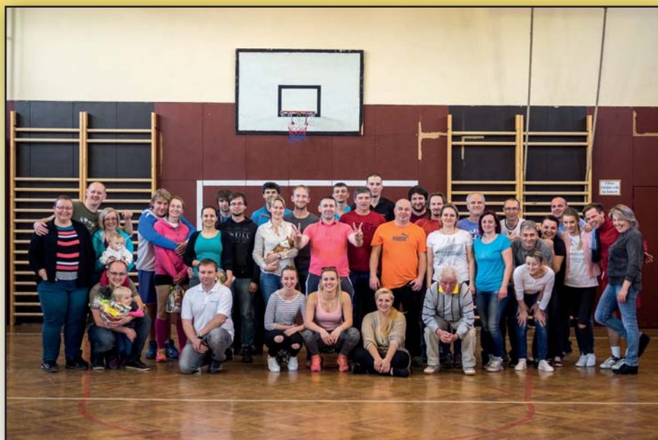
SK Březolupy, oddíl volejbalu, uspořádal 1. dubna 2017 tradiční Pouliční volejbalový turnaj.