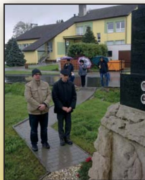
Kladení věnců 28. 4. 2017