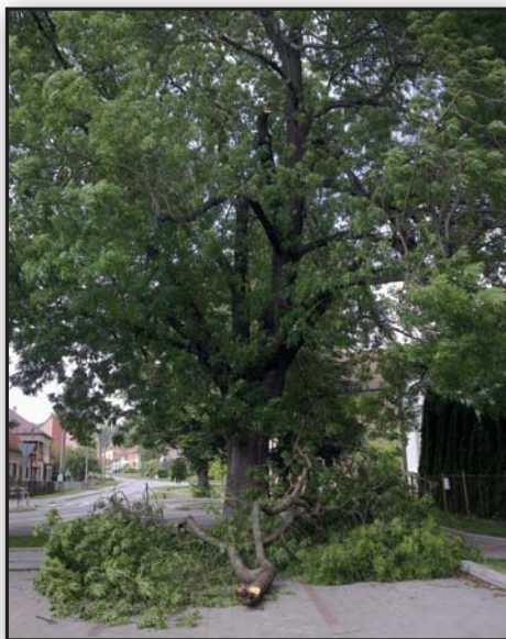
Spadená větev jasanu před ZŠ 4. 6. 2017