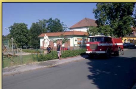
Hasiči pomáhají se zaléváním mladých stromků