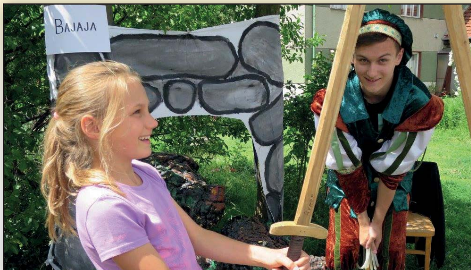
Putování čarovným světem