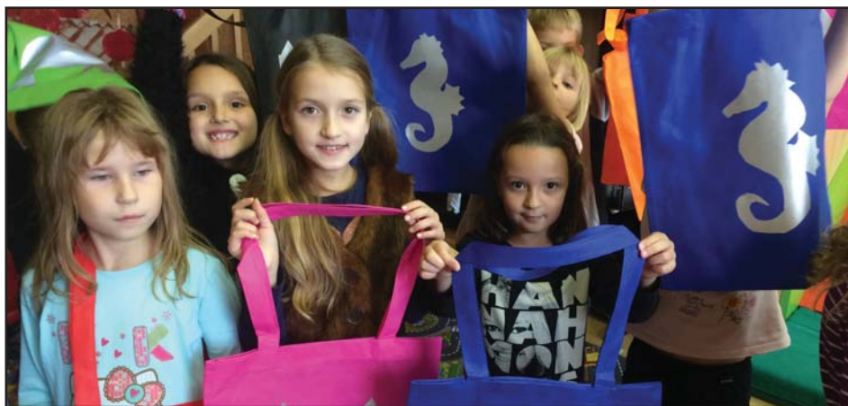
Radost z tvoření je znát – dílničky v základní škole

Tvořivé dílničky, do kterých se zapojují převážně žáci 1. stupně, probíhaly jednou za měsíc. Děti si vyrobily plátěné tašky a pohankové polštářky.