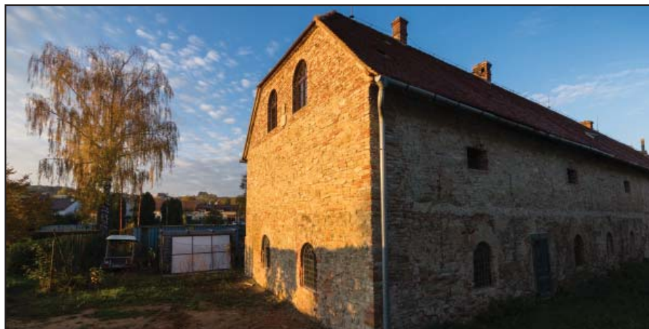
Opravený jihozápadní štít objektu Podzámčí