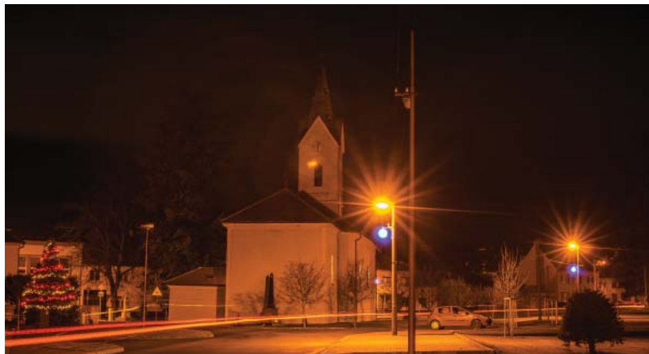
Březolupský kostel v adventním večeru

Zaradoval jsem se ještě více, když papež František vydal v letošním roce exhortaci Amoris laetitia , tzn. „Radost z lásky“. Papež dává obyčejné a skromné rady, které jsou aktuální především o Vánocích.