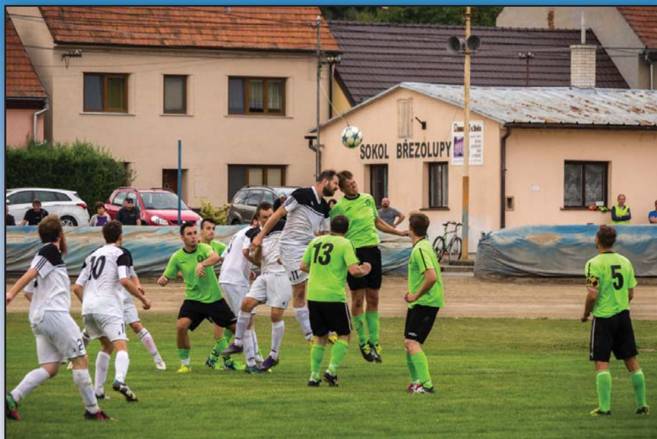
Zápas Březolupy – Zborovice