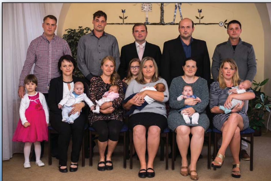
Vítání občánek 25. 9. 2016