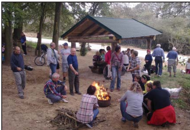
Cíl putování po altánech 28. 9. 2016 – altán Buchlov

Co se týká příprav akcí pro příští rok či roky pak téměř před dokončením, případně již ve fázi získávání stavebního povolení, máme revitalizaci rybníka Hluboček a jeho okolí či Polní cestu Chrástka. Místní komunikace Spodní