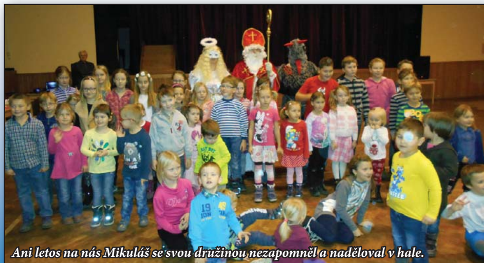
Ani letos na nás Mikuláš se svou družinou nezapomněl a naděloval v hale.