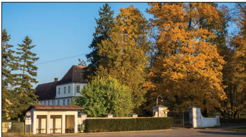
Současná podoba prostoru autobusové zastávky U zámku