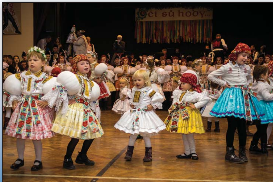
A malá hodová chasa....