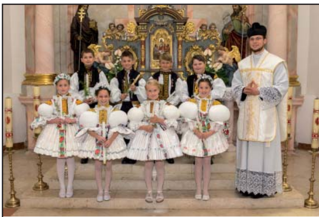
Svaté přijímání 31. 5. 2015.

letošními prázdninami, abychom dokázali žasnout nad běžnými skutečnostmi života, které tolik přehlízíme. Jsou někdy až tak samozřejmé a jednoduché. Vystupte o prázdninách i na malinký vrchol hory a podívejte se do krajiny, kde všechno působí harmonicky a krásně a vypovídá o tom, kdo dal všemu řád a krásu. Nebo se s někým zastavte, i s někým neznámým a poznejte, v čem je ten člověk pro vás darem, co se můžete od něho naučit. I o prázdninách se můžeme učit sami žasnout a pomáhat dětem objevovat něco nového, co ve školních lavicích děti neobjeví.